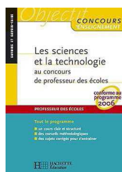
Les sciences et la technologie au concours de professeur des écoles